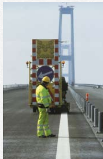
ViaTherm®产品 可制作 普通或特殊标 识。